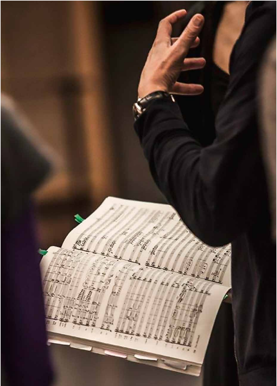
John Neumeier probt sein Ballett Das Lied von der Erde