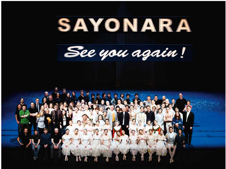
Gastspiel in Tokio im März 2016