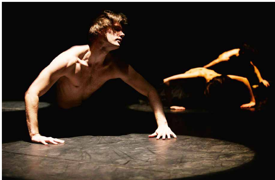
Junge Choreografen 2015